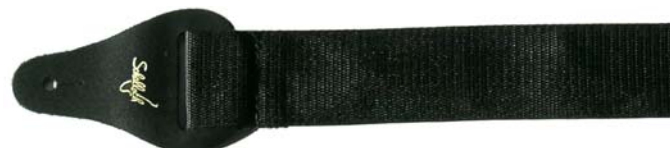
N-098-LOGO Polywebbing, Leather Ends, Plastic Slide, 5cm wide, Made to order with customer logo Nylon, bouts en cuir, 5cm, peut être commandé avec un logo personnalisé